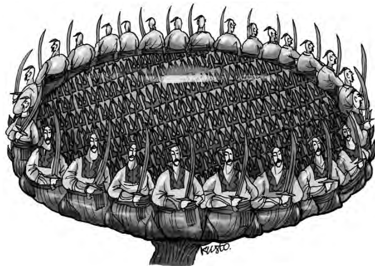
«Ми є. Були. І будем МИ! Й Вітчизна наша з нами!» (Іван Багряний, поема «Мечоносці»).