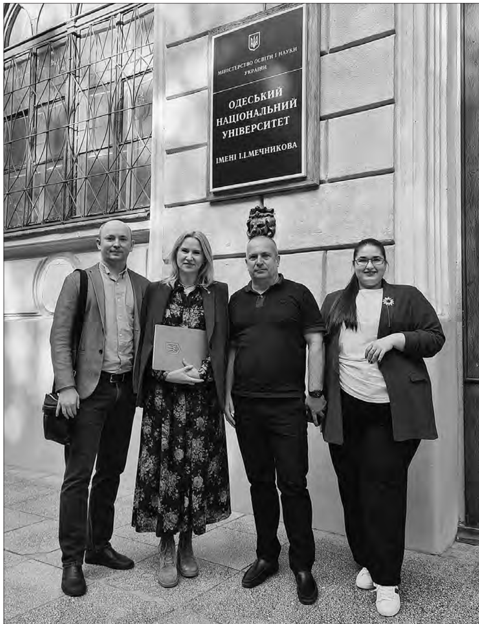
Керівниця Освітнього центру Верховної Ради України Олена Костинюк, ректор ОНУ імені І. І. Мечникова Вячеслав Труба, Заступниця Голови Верховної Ради України Олена Кондратюк, радник Віцеспікерки Павло Булгак.

«У чому я точно впевнена, і це насправді дає нам надію, — це оптимізм української молоді. 86% молодих людей пов'язують своє майбутнє з Україною. Важливо, щоби молодь могла впливати на рішення при повенній відбудові нашої країни та брала активну участь не лише у